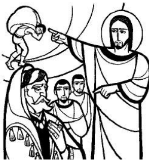
figura di Gamaliel (At 5,34-39) come dottore della Legge aperto e possibilista verso la nascente comunità cristiana. Con buona probabilità possiamo dire che la forte polemica antifarisaica di Matteo nasce in un contesto storico in cui, dopo la distruzione del tempio, il movimento dei farisei è rimasto l'unico realmente attivo dal punto

Detto questo proviamo a cogliere da queste scritture qualche spunto di riflessione più preciso. Iniziamo da Matteo. Intanto conviene dire subito che il nostro evangelista non è molto oggettivo nei confronti del movimento farisaico. Infatti, come sappiamo dagli altri vangeli Gesù ha incontrato anche farisei ben disposti nei suoi confronti o, comunque, non ostili a priori. Giusto per fare qualche esempio Giovanni considera Nicodemo e Giovanni d'Arimatea discepoli in segreto; gli Atti degli Apostoli ci ricordano la